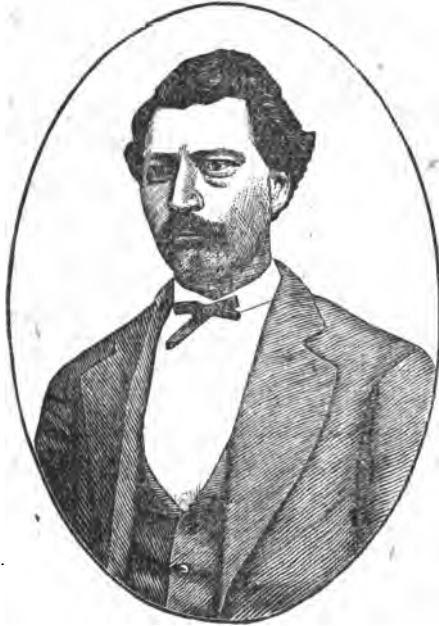
M. LOUIS RIEL.

THE PUBLIC LIBRARY 784250 AT OXFORD AND JAN 1 1893